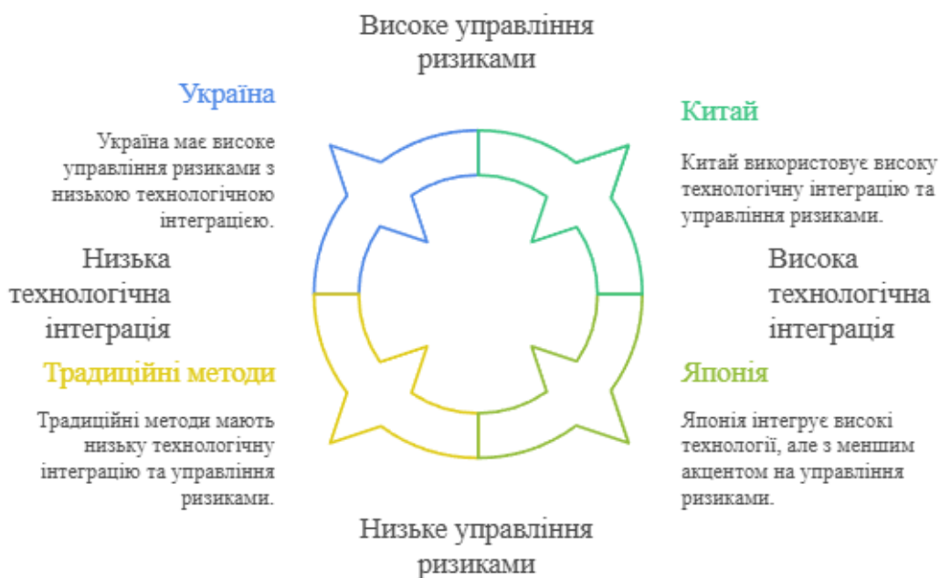
Рис. 2. Систематизація наукових підходів до управління деструктивними процесами в будівництві на основі міжнародного та українського досвіду (розроблено автором на основі [14])

Для кращого розуміння еволюції підходів до управління деструктивними процесами у будівництві доцільно представити рисунок 2, який систематизує основні напрямки міжнародних і українських досліджень, показуючи взаємозв'язок між цифровими технологіями, ризик-менеджментом і організаційною надійністю будівельних систем [12].