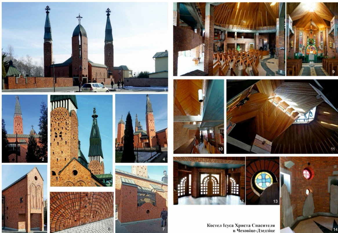
Рис. 3. Костел Ісуса Христа Спасителя у Чеховіце-Дзедзіце.