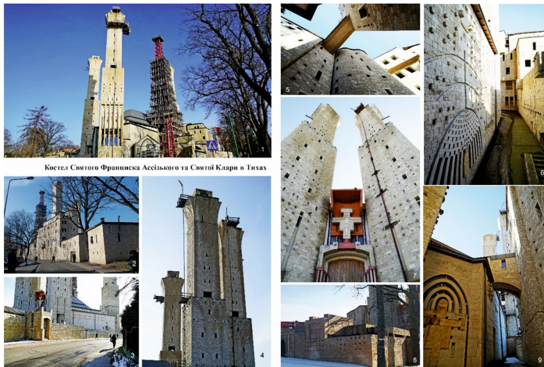
Рис. 4. Костел Святого Франциска Ассізького та Святої Клари в Тихах. Загальний вигляд та фрагменти комплексу монастиря. Світлина Г.О. Осиченко, 2019

з'єднувальні переходи, що створюють враження блукання стародавнім містом (див. рис. 4.6-4.9).