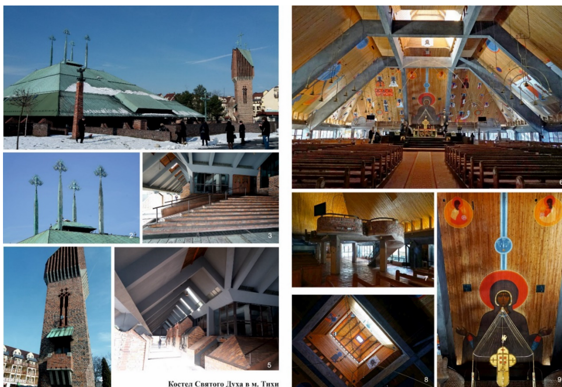
Рис. 2. Костел Святого Духа в м. Тихи. Світлина Г. Осиченко, 2019

КОСТЕЛ СВЯТОГО ДУХА в Тихах. Храм будувався з 1978 по 1983 рік будівельною бригадою з дев'яти пенсіонерів, яким допомагали волонтери. Будівля костюлу має форму намету, що є відсиланням як до біблійних часів (що нагадує намет, який Мойсей встановив у серці пустелі на прохання Бога), так і до стародавніх польських дерев'яних церков (рис.2). Ліворуч від церкви розташована цегляна дзвіниця оригінальної форми, дах церкви увінчаний чотирма струнками хрестами (рис.2.4 та 2.2). Інтер'єр церкви прикрашений барвистими поліхромними розписами Єжи Новосельського, що виконані безпосередньо на стінах і стелях (рис. 2.6 та 2.9). У 2020 році храм було внесений до реєстру пам'яток Сілезького воєводства.