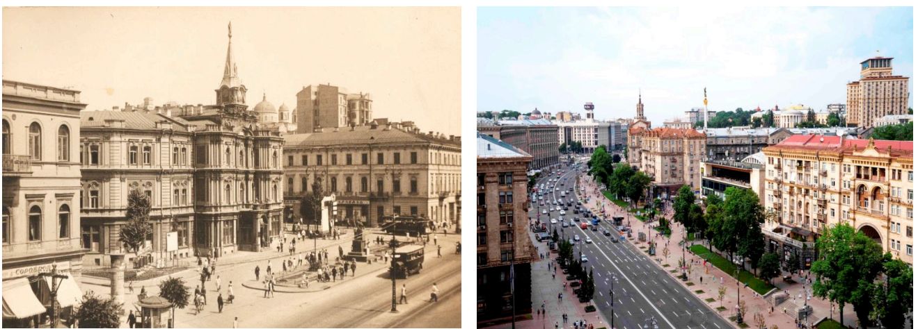
Рис. 4. Історична забудова київського Хрещатика XIX – початку XX ст. та сучасний вигляд

Показовим є приклад Хрещатика, де історична забудова XIX – початку XX ст. була втрачена, а сучасний архітектурний образ головної вулиці сформувався у 1950-х роках у стилі сталінського ампіру (рис. 4).