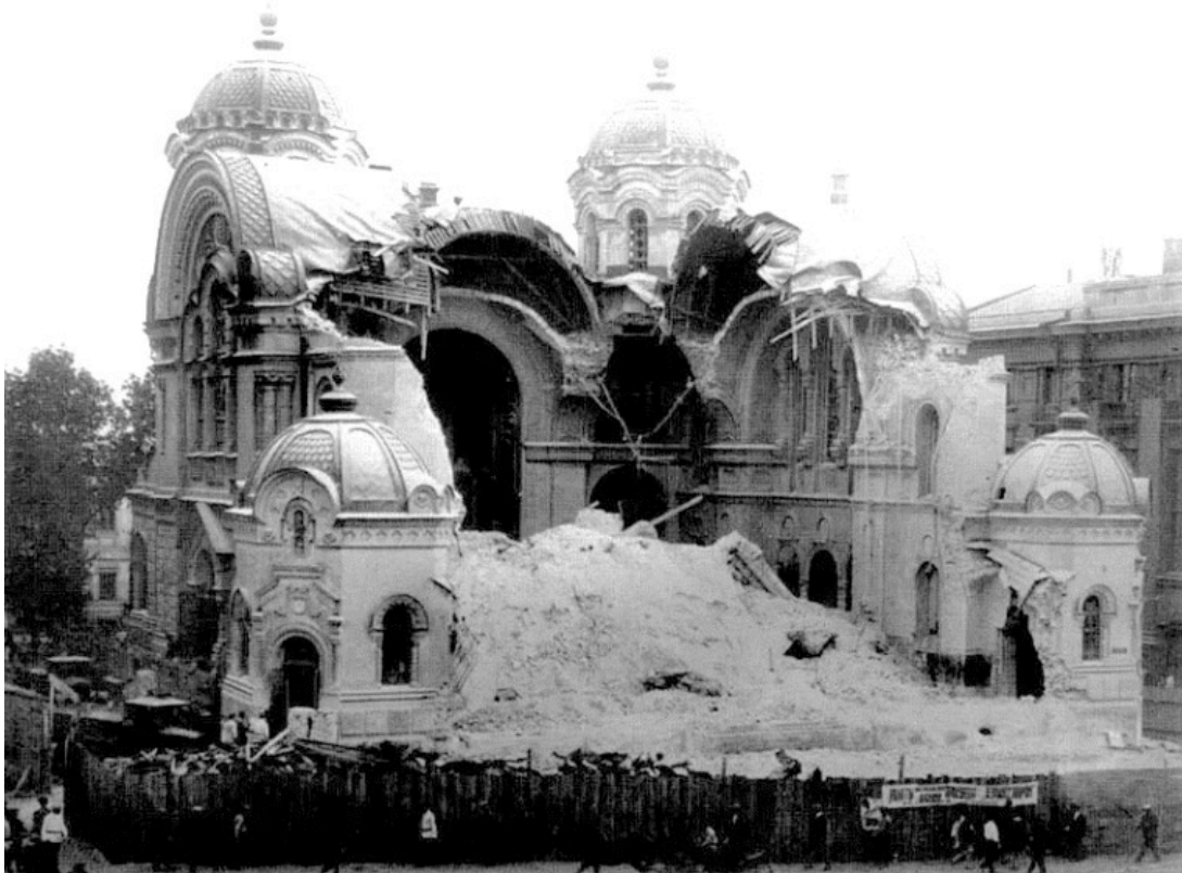
Рис. 2. Зруйнований Миколаївський собор у Харкові, 1930 р.

місця ні релігії, ні різноманіттю культури, ні історії та самобутності українців. У результаті сотні старовинних храмів, монастирів, замків, палаців було стерто з лиця землі. Ті, що залишилися, було перетворено на склади, фабрики і навіть тюрми (рис.2).