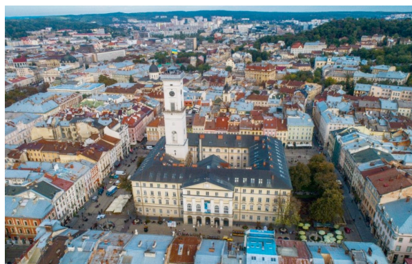
Площа Ринок у Львові (Україна)

Результати дослідження та їх обґрунтування. Українські міста, попри різне географічне розташування та історичне минуле, мають характерні риси, притаманні європейським містобудівним традиціям, що свідчить про належність їх саме до європейської цивілізації. Ця спільність особливо виразно простежується у формуванні головних площ, які в українських та західноєвропейських містах виконували подібні просторові й суспільні функції. Показовим прикладом є порівняння Площі Ринок у Львові та Stary Rynek, де чітко виявляються спільні риси європейської містобудівної традиції в організації центрального міського простору (рис.1)