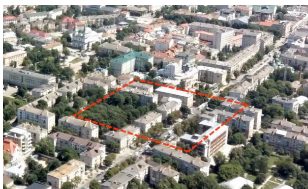
Теперішній вигляд місця, де була ринкова площа у Тернополі