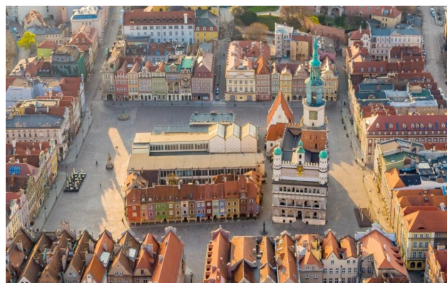
Площа Stary Rynek у Познані (Польща)