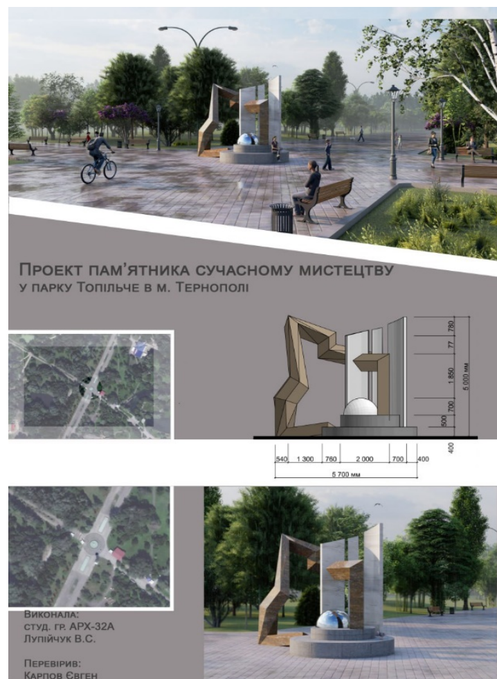
Рис. 1. Проєкт пам'ятника сучасному мистецтву в парку «Топільче» у Тернополі. Виконала здобувачка архітектурного факультету КНУБА В. Лупійчук. Керівник Є. Карпов.

Одне із завдань полягало у створенні скульптурного об'єкта у міському парку з метою його осучаснення. Здобувачка обрала паркову зону м. Тернополя, яка потребувала виразного композиційного центру. Після ґрунтовного дослідження довкілля і ландшафтних особливостей парку вона спроектувала «Пам'ятник сучасному мистецтву» (рис. 1).