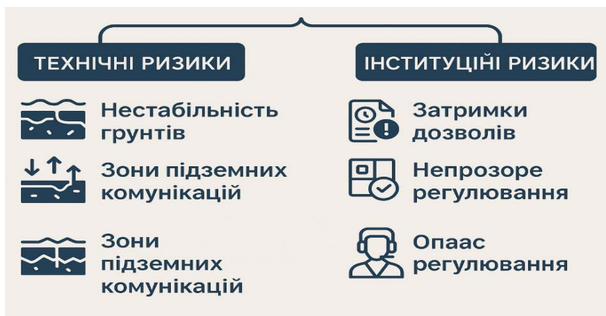
Рис. 3. Класифікація технічних і інституційних ризиків, що підлягають нейтралізації під час інженерної підготовки (розроблено авторами на основі [8])

Щоб забезпечити комплексне розуміння того, які саме ризики піддаються впливу на етапі інженерної підготовки, доцільно звернутися до рисунка 3, він показує їх типологію з розподілом на технічні та інституційні.