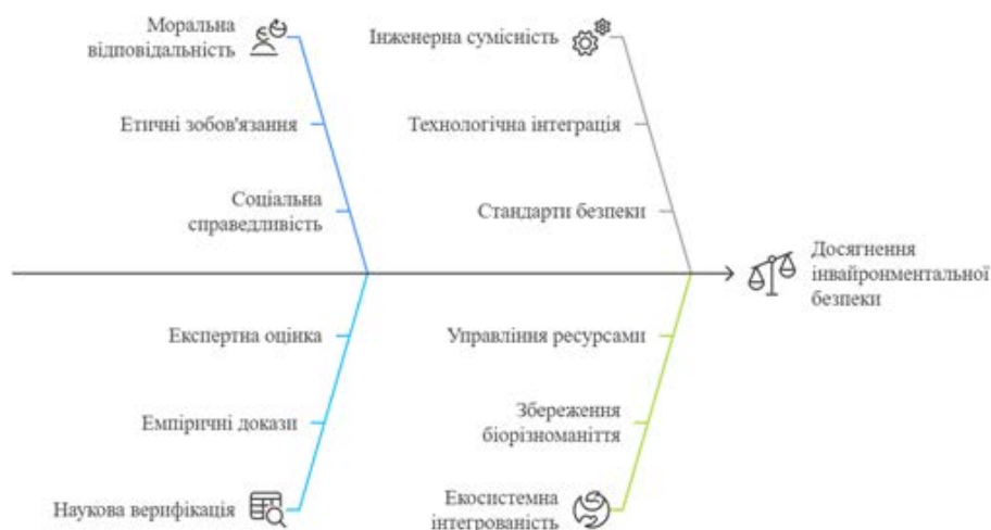
Рис. 1. Аналіз інвайронментальної безпеки як системної категорії (розроблено автором на основі [7])

Як ми можемо побачити на рисунку 1, інвайронментальна безпека постає не як одномірне явище, а як складна система взаємопов'язаних рівнів, що охоплюють як етико-ціннісні, так і технологічні й нормативні компоненти [7].