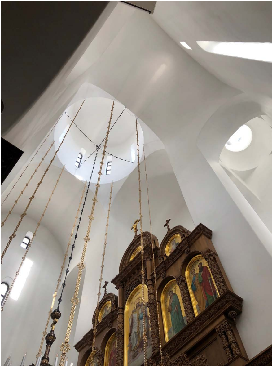
Рис.4. Інтер'єр храму Всіх Святих в Умані.

Традиційна поліхромія включає білий, блакитний, золотий кольори як основні. В інтер'єрах церков іконостаси виконані за старовинними канонами, стіни в інтер'єрах прикрашені стінописами і подекуди мозаїками (Рис. 4).