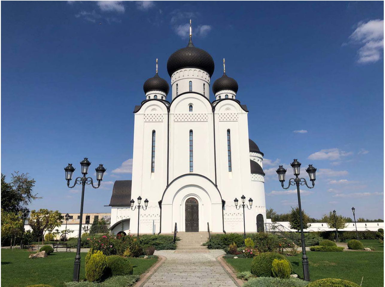
Рис.1. Храм Всіх Святих в Умані. Західний фасад.

Свято-Михайлівський кафедральний собор в Черкасах відзначається масштабністю, він зведений в неовізантійському стилі і має декорований інтер'єр. Об'ємно-просторова композиція з дев'ятьма банями, з яких одна є центральною, є прямою алюзією до давньоруських храмів першого періоду – Десятинної церкви і Софійського собору в Києві (Рис.2). Ця алюзія підкреслена і цегляним муруванням з арочними вікнами і мозаїками (Рис.3). Унікальний іконостас собору виготовлений за старовинними канонами. Таким чином виражена ідея спадкоємності православного храмобудування Черкащини з давньоруським періодом храмобудування, а сам регіон трактований як такий, який має давні християнські традиції.