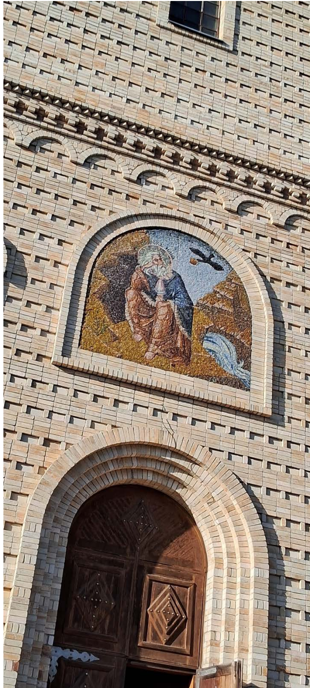
Рис.3. Мозаїка на фасаді Свято-Михайлівського собору. Фото П.Білоус,2024

образ храму: «Храм не може бути просто будівлею проявляється і в його архітектурі, і в атмосфері молитви, і в кожній деталі його оздоблення».