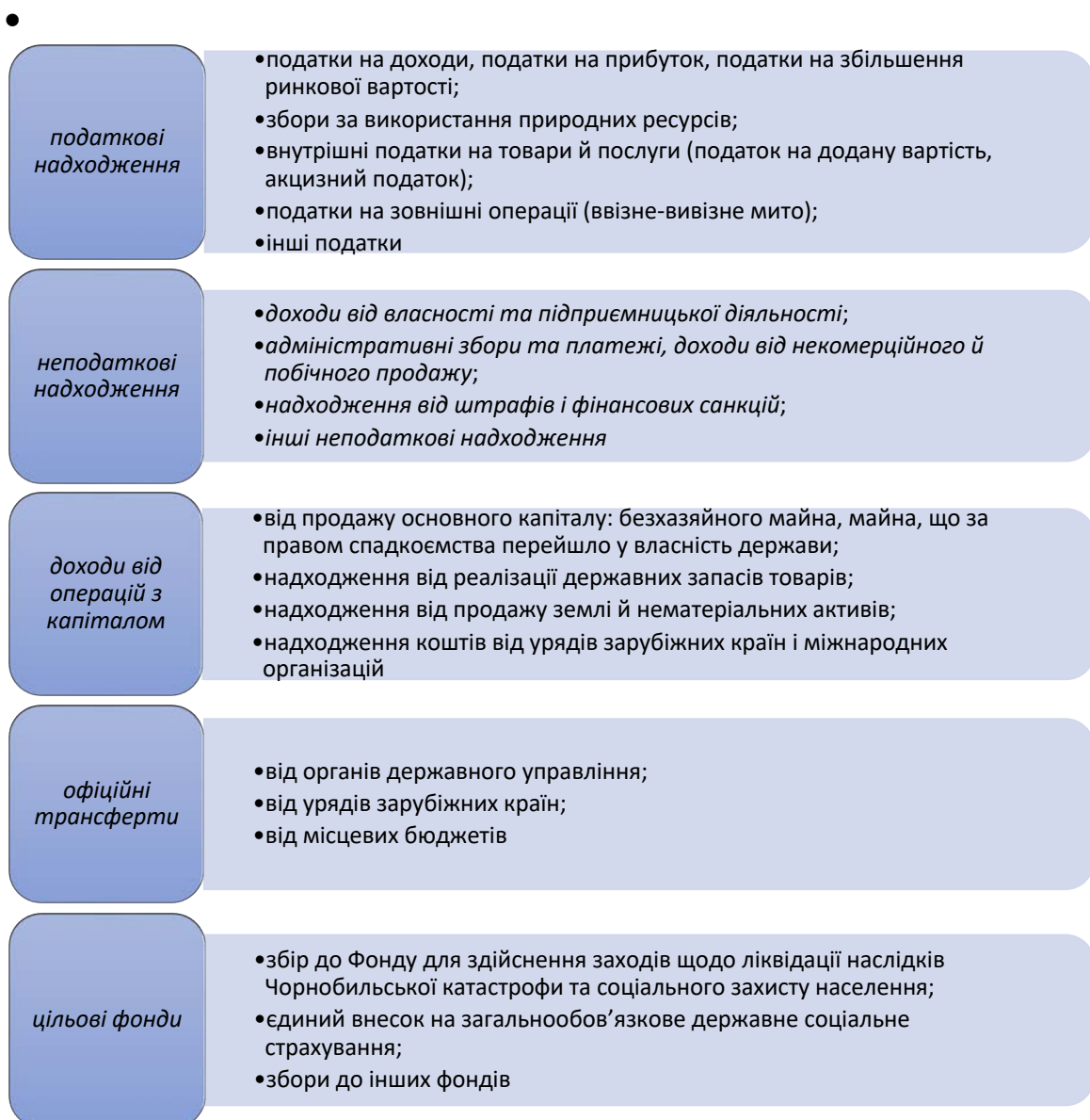
Рис. 2. Класифікація доходів бюджету відповідно до бюджетної класифікації. [8]