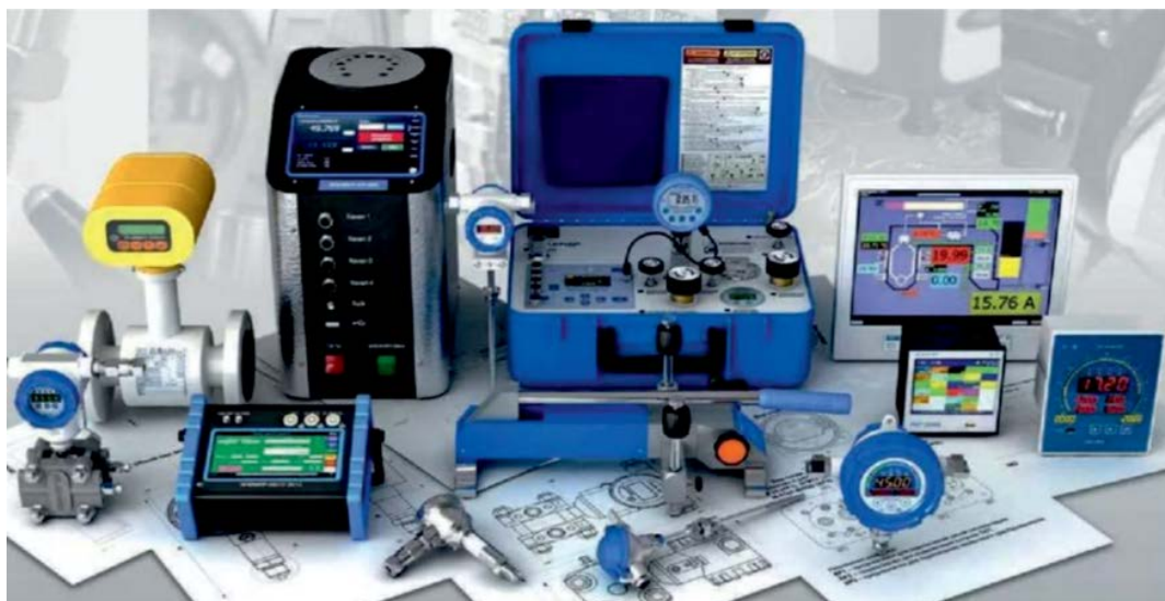
Рис. Контрольно-вимірювальна апаратура

До складу КВА автори [11], включають вимірювальні прилади (датчики, перетворювачі) серійного (промислового) типу, що пройшли метрологічну атестацію та сертифікацію, що задовольняють вимоги по точності та діапазоні вимірювань, довгострокової стабільності (рис. 2).