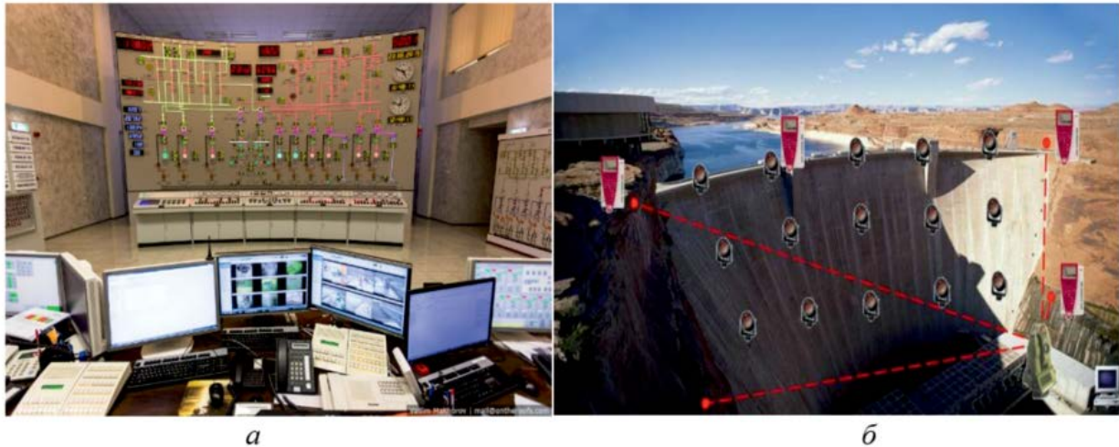
Рис. 1. Пульт управління Кременчуцької ГЕС (а) та розміщення КВА у греблі Канівської ГЕС (б)

витримати потік води. Автори [10], описують оснащення основ гідротехнічних споруд (ГТС) на період їх експлуатації контрольно-вимірювальними апаратурами (КВА) яке здійснюють, головним чином, у період їх будівництва в спеціальному проєкту натурних спостережень (моніторингу) (рис. 1).