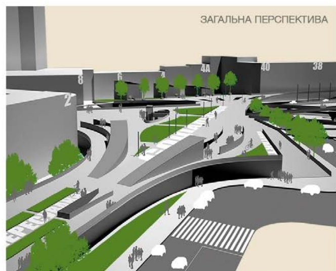
Рис. 1. Прийоми, що розкривають принцип «історичної спадкоємності». Проектна пропозиція організації відкритого публічного простору Львівської площі в місті Києві.