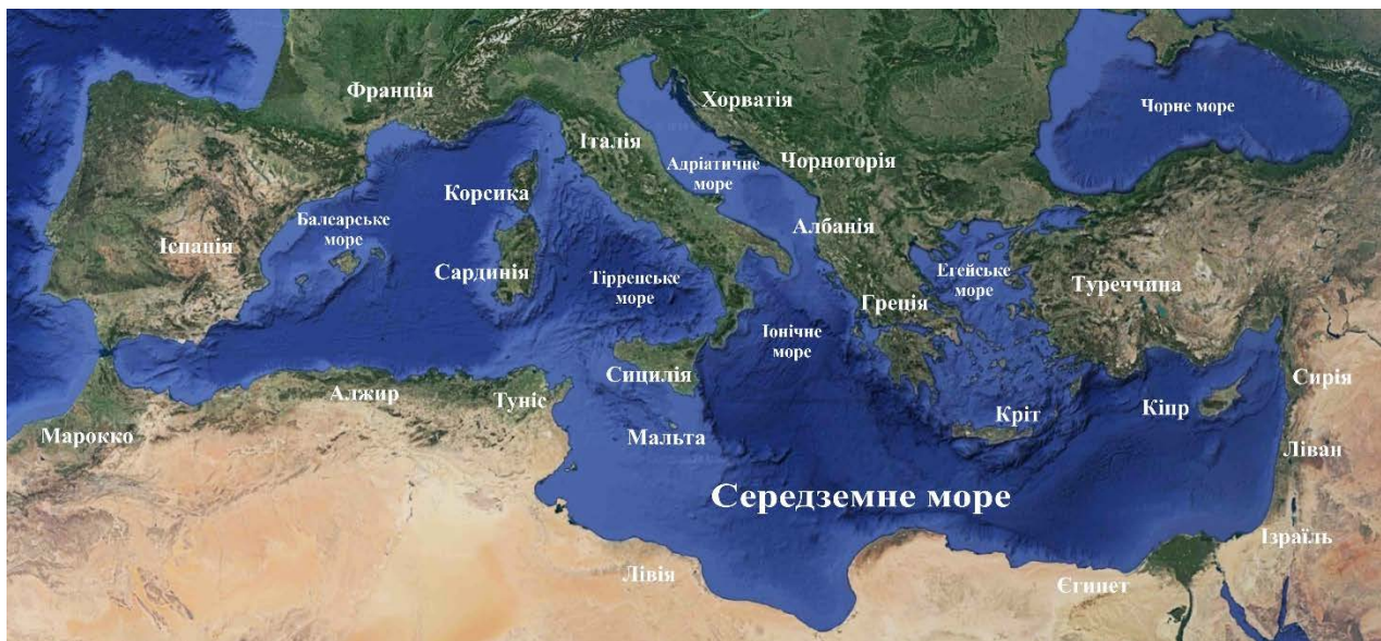
Рис. 1. Басейн Середземного моря

територій всього Середземномор'я Римською імперією воно перетворилося на найрозвиненіший регіон Стародавнього світу [1, 2].