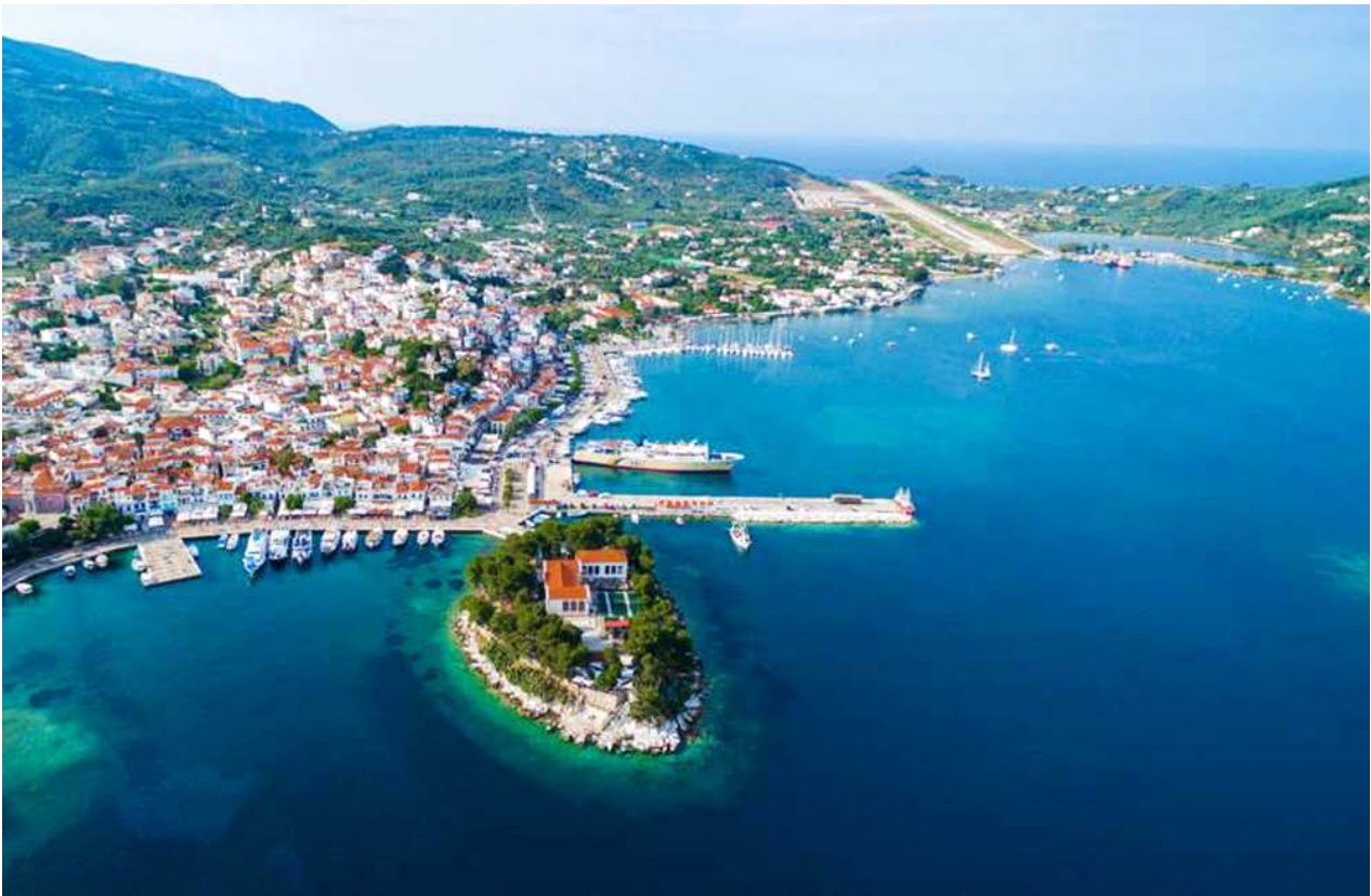
Рис. 3. Місто Скіатос, вид на порт та аеропорт

селища з багатою туристичною інфраструктурою. Жителі острова переважно задіяні у сфері туризму, сільського господарства та рибальства (рис. 3) [5, 6].