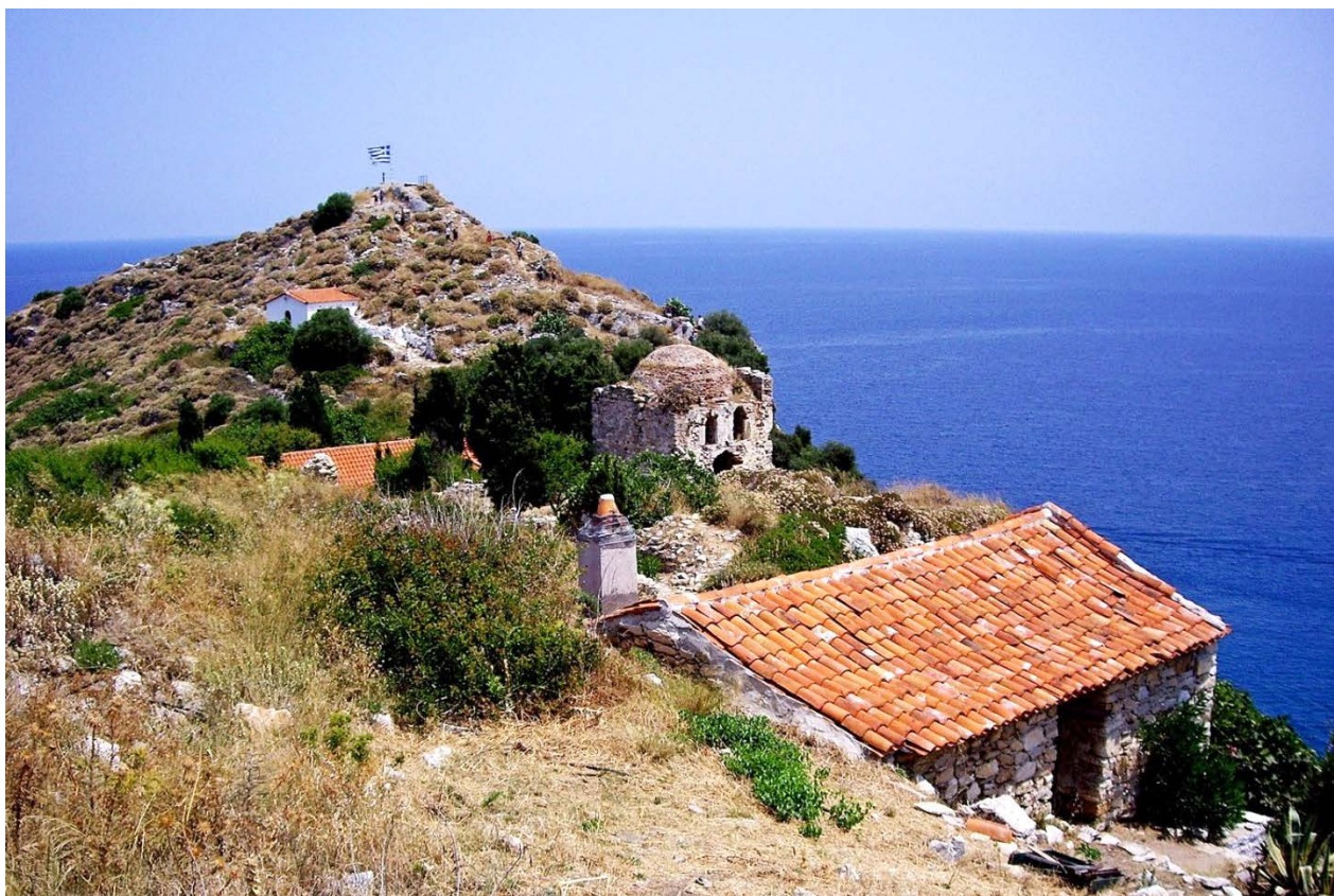
Рис. 4. Руїни фортеці міста Кастро

1276 року. Потім він знову був відвойований Візантією і залишався до падіння Константинополя в 1453 році. У цей період він сильно постраждав від піратських набігів, в результаті яких в середині 14 століття жителі покинули старе місто і побудували нове, тепер відоме як Кастро, на крутому скелястому мисі на самій північній частині острова; збереглися руїни цього середньовічного міста: вулиці, будинки та церкви. Церква Різдва Христова 17 століття досі перебуває у доброму стані та має безліч прекрасних ікон (рис. 4).