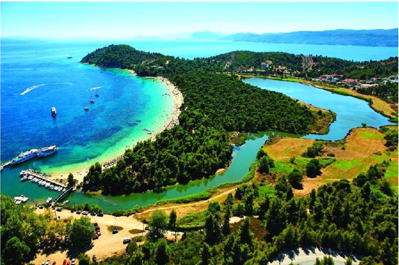
Рис. 5. Вид на Пляж Кукунарієс, сосновий гай та лагуну Строфілія

Все південне узбережжя обрамлене красивими пісочними пляжами, які порожньо сходять до Егейського моря. Найбільш відомими туристичними центрами південного берега острова Скіатос є Агія Параскеві, Кукунарієс та Мегалі Аммос (рис. 5).