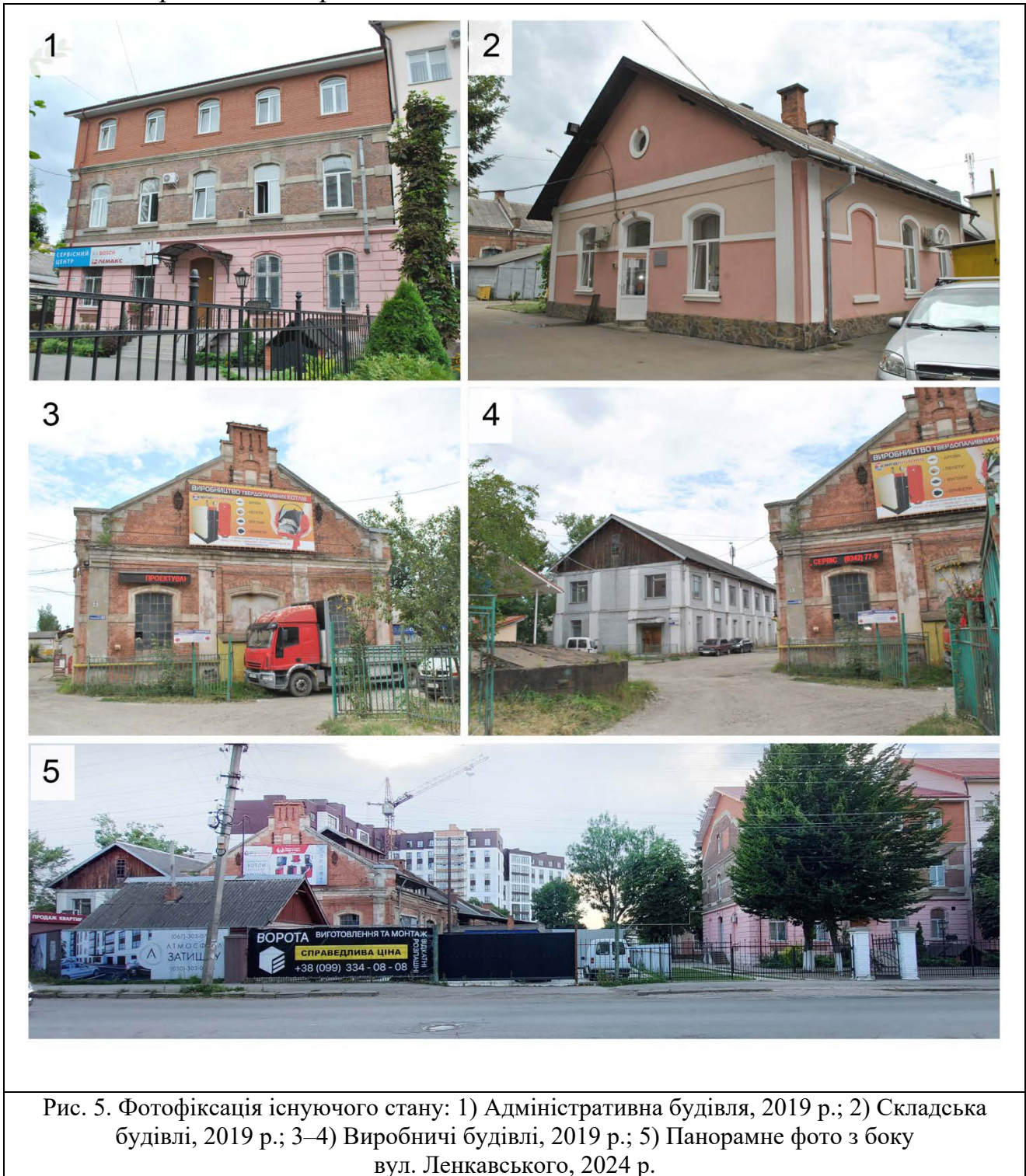
Рис. 5. Фотофіксація існуючого стану: 1) Адміністративна будівля, 2019 р.; 2) Складська будівлі, 2019 р.; 3–4) Виробничі будівлі, 2019 р.; 5) Панорамне фото з боку вул. Ленкавського, 2024 р.