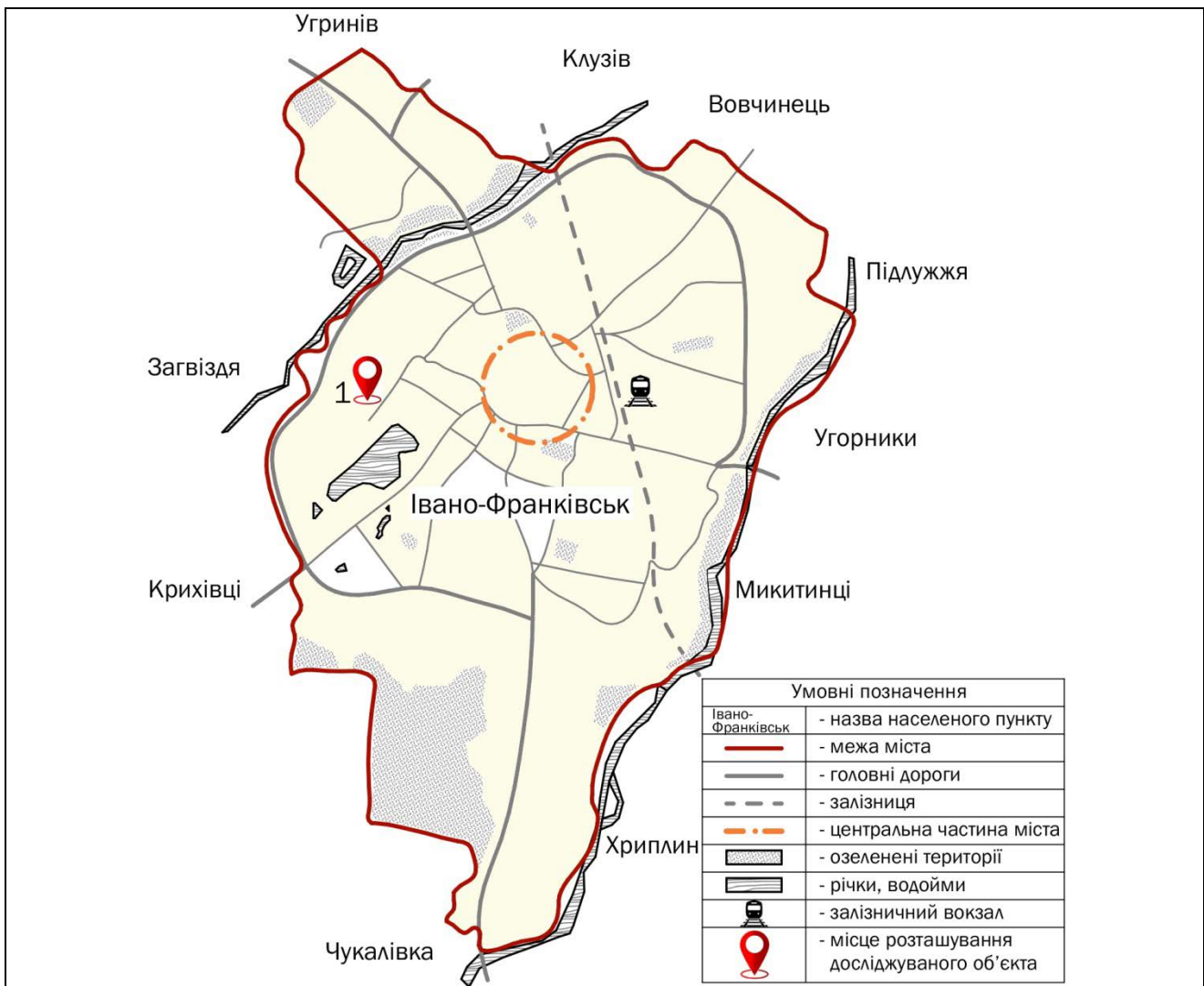
Рис. 3. Місце розташування досліджуваного об'єкта в межах міста станом на 2024 р.

– Будівля складів та майстерень. Одноповерхова, цегляна, тинькована. Поле фронту з круглим отвором та профільованим обрамленням. Фасади декоровані гладкотинькованою профільованою тягою, лопатками та підвіконними карнизами. Будинок у доброму стані та входить до комплексу споруд ВАТ «Івано-Франківськгаз».