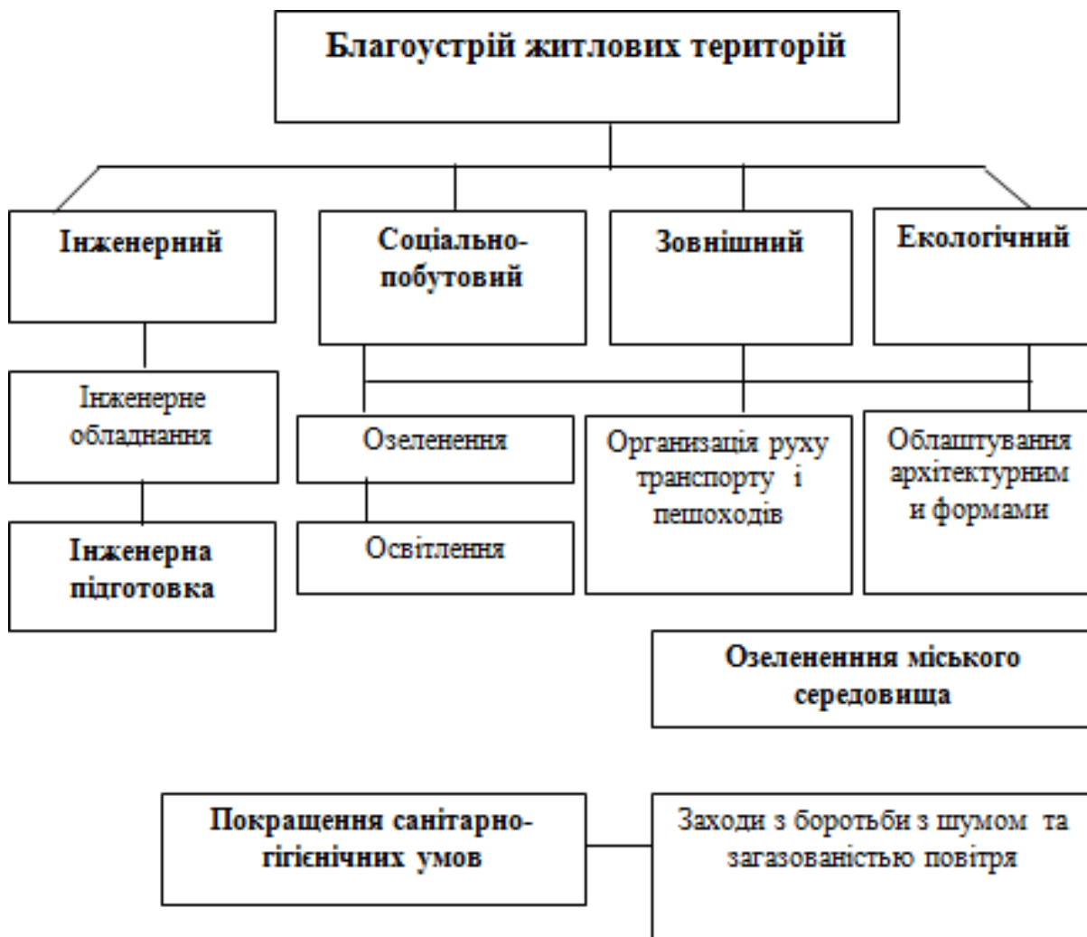
Рис.1. Склад заходів з благоустрою

Комплекс заходів з благоустрою включає також роботи, пов'язані з оздоровленням довкілля, покращенням санітарно-гігієнічних умов територій житлової забудови, що забезпечують екологічний благоустрій території. Склад заходів щодо благоустрою житлових територій наведено на рис.1. [25]