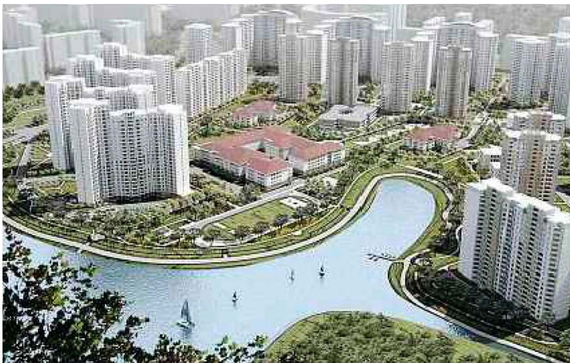
Рис.2. Загальний вид мікрорайону №2 Позняків

Існуюча житлова забудова мікрорайону представлена 9-16-24 поверховими будинками. Збудова має багатофункціональний характер і включає в себе житлові, комунальні, навчальні, промислово-виробничі та інші будівлі. Втім, основним функціональним призначенням цієї території є житлове (рис. 2).