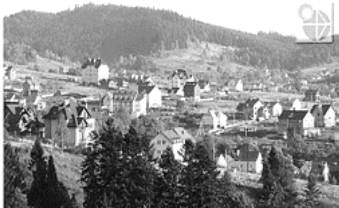
Рис. 2. Санаторно-курортні заклади в структурі селища Східниця