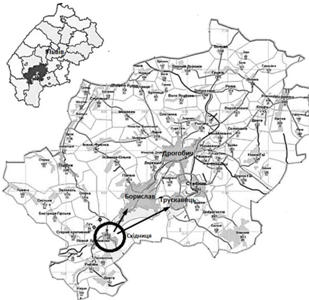
Рис. 1. Субрегіон Трускавець (за матеріалами Стратегія розвитку Трускавецького субрегіону до 2028 року) [5]

«Курортполіс Трускавець» - єдине в Україні експериментальне явище, вузьноспеціалізована СЕЗ, пріоритетним завданням якої було сприяння розвитку туристично-рекреаційного та санаторно-курортного господарств, медицини та охорони здоров'я. У цьому контексті в 2005 році Східниця стає Всеукраїнським курортом Омеляна Стоцького.