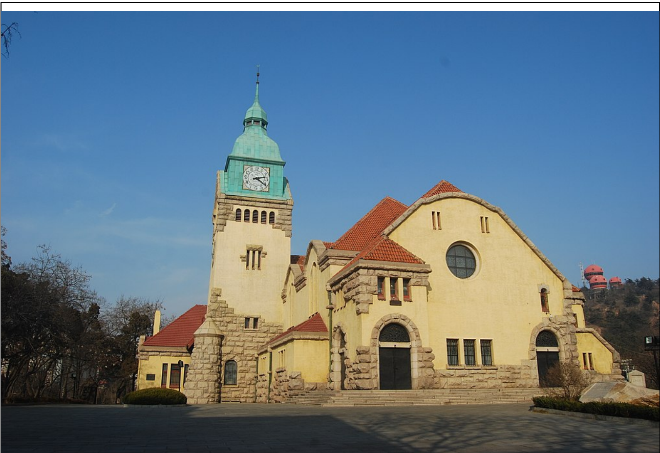
Рис.2. Протестантська церква Циндао. Вигляд з головного (південного) фасаду.

Місце для церкви було вибрано не випадково, недалеко від паркової зони з Резиденцією губернатора, що додатково свідчить про важливість цього об'єкту саме з ідеологічної точки зору.