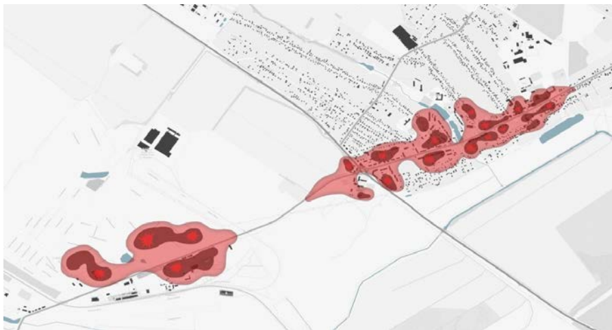
Рис. 1. Зона значних руйнувань центральної частини селища Бородянка, 2022 р.

Як приклад запропонована модель лінійно вузлового розвитку [5, 2, 10, 19]. (Рис. 1, 2)