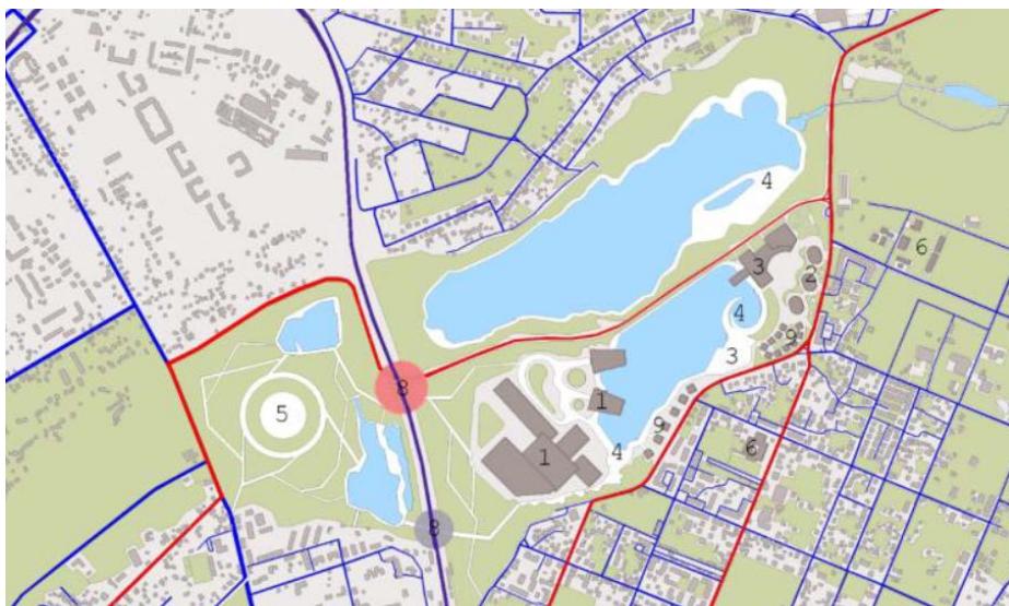
Рис. 4. Загальний вигляд частини міста після реконструкції

Проектною пропозицією стало створення системи навчальних закладів різних галузей, що надасть місту можливість створити ще одну потужну функцію для майбутнього розвитку. Пропозиція побудована на залученні існуючих методів реконструкції, головним з яких є покращення природного середовища. (рис. 4)