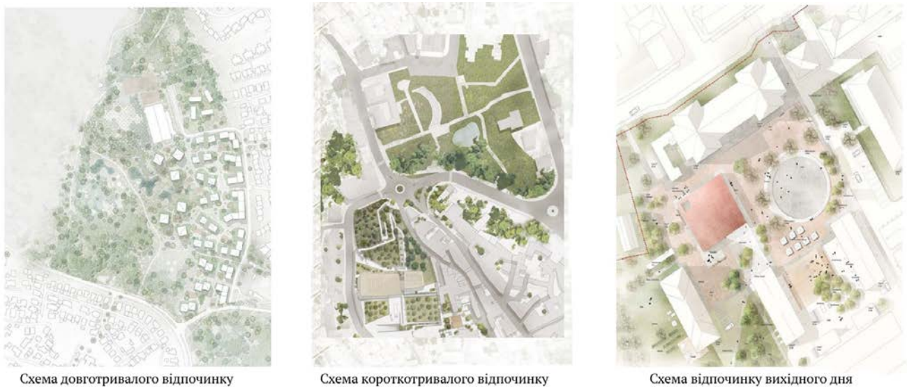
Рис. 7. Проектна пропозиція трьохрівневої системи вузлів відпочинку м. Чернігів

Такими роботами стали “Принципи визначення потенціалу для розвитку екологічного туризму (на прикладі Чернігівської області)” Реброва Катерина Дмитрівна (Рис.7) [20]; “Принципи формування рекреаційних поселень на основі мобільних будинків у м. Новій Каховці, Херсонської області” Малига Поліна Олегівна [21].