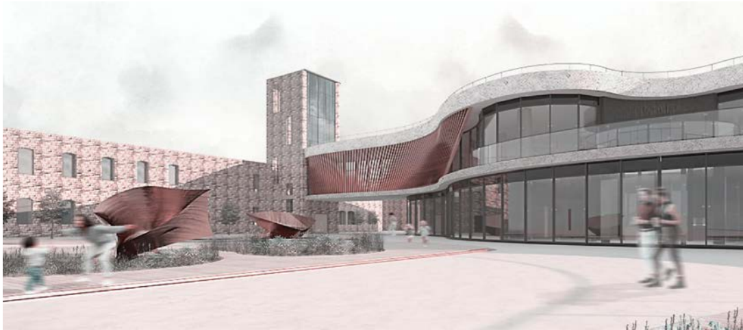
Рис. 8. Загальний вигляд інноваційного центру.

Велика частка робіт присвячена навчальній, культурній та історичній темі пов'язаній з вивченням нашої історії, її популяризації, і що особливо - це все хвилює молодих архітекторів, які будуть відбудовувати країну, А з такими ідеями, бажанням ми переможемо і все відновимо ще більш сучасне та красиве.