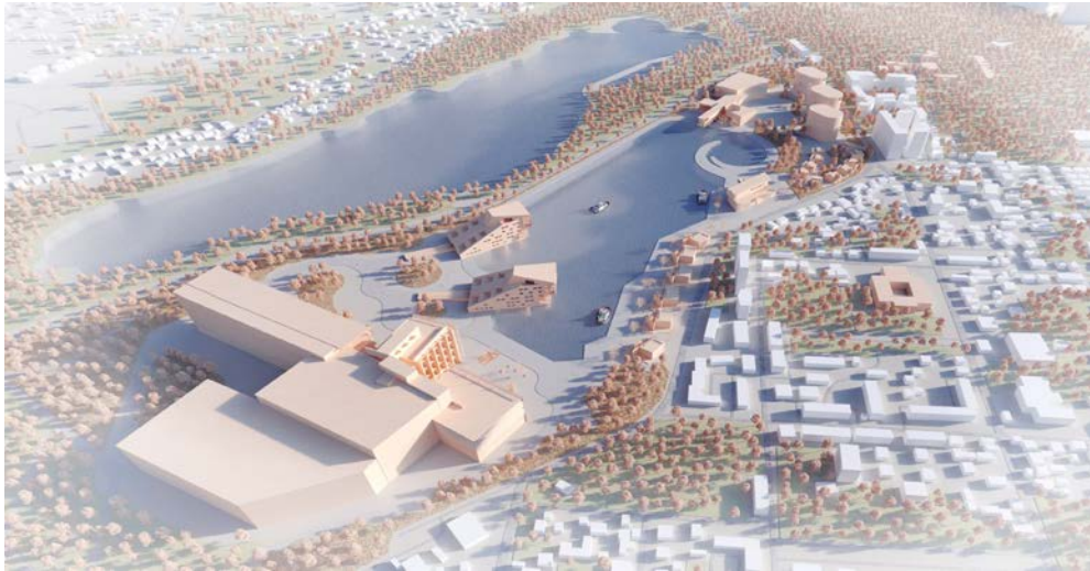
Рис. 5. Загальний вигляд реабілітаційного центра

Важливою темою стали ідеї різного виду реабілітації людей в післявоєнний період, це роботи: “Принципи формування рекреаційних територій для реабілітації людей, що постраждали від російської агресії (на прикладі с. Рожни Київської області) дипломна робота Гаврилів Анастасії Віталіївни [18].