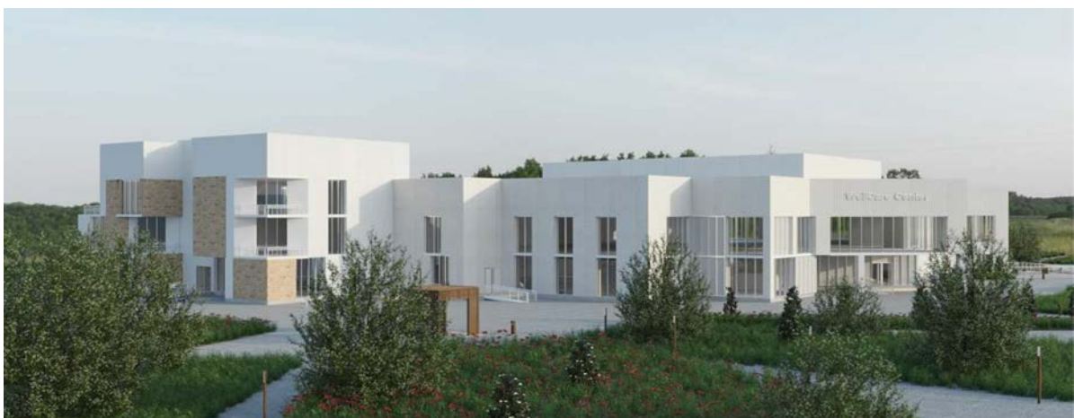
Рис. 6. Проектна пропозиція