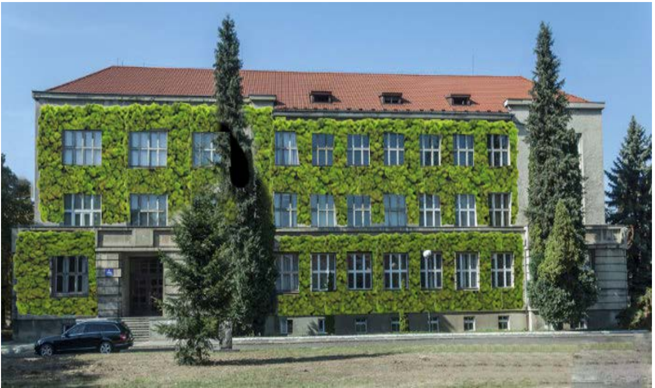
Рис.5б. Медичний факультет Ужгородського національного університету.