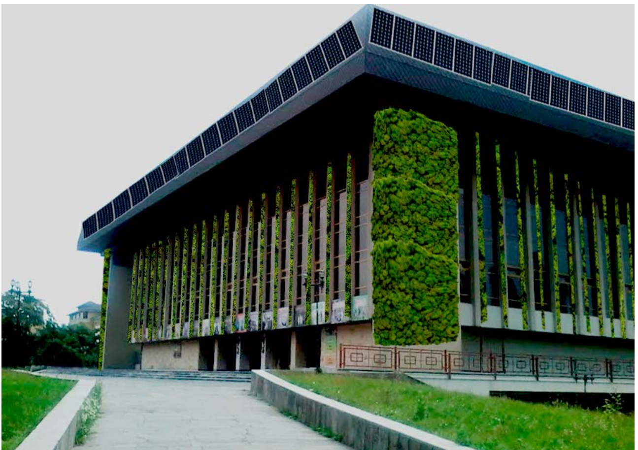
Рис.6а. Музично-драматичний театр м. Ужгорода