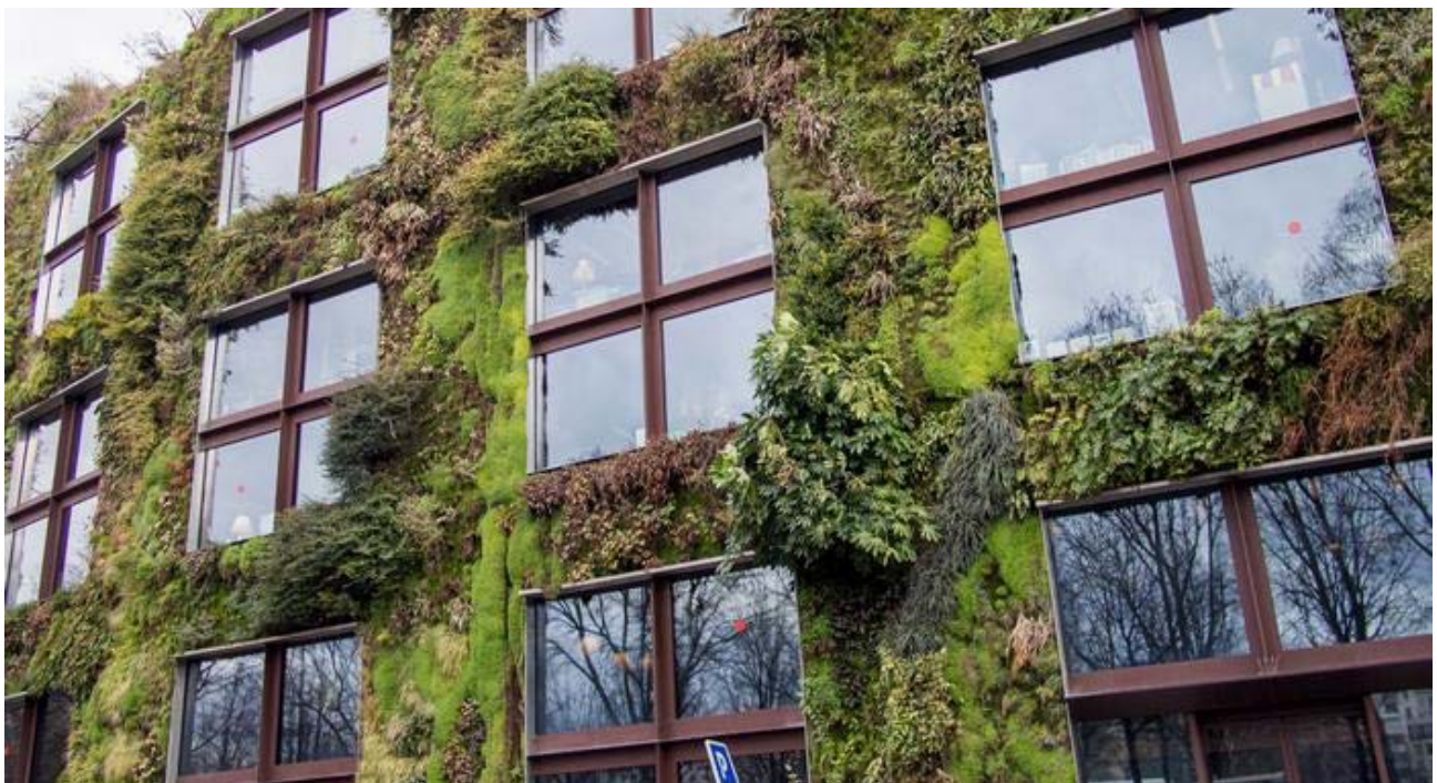
Рис.1. Музей на набережній Бранлі у Парижі

Ідея про перенесення зеленої рослинності з горизонтальної площини в вертикальну була вперше реалізована французьким ботаніком та дизайнером Патріком Бланом (фр. Patrick Blanc), в 1988 році. Яскравий приклад його роботи - музей на набережній Бранлі у Парижі (Le musée du quai Branly - Jacques Chirac), відкритий в Парижі в липні 2006 (рис.1).