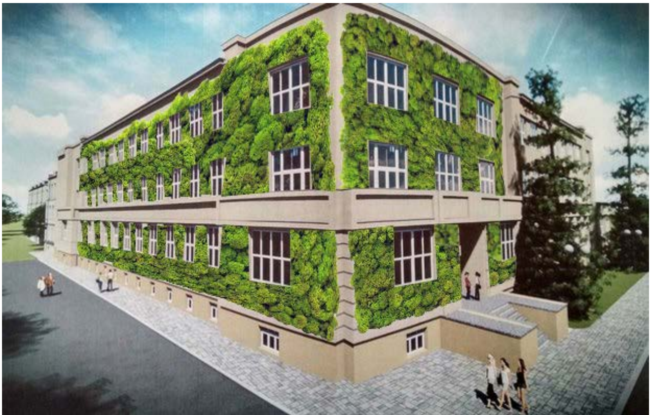
Рис.5а. Медичний факультет Ужгородського національного університету.

Як бачимо з табл.2 економічно найефективнішою є повстяна, а найбільш затратною є модульна, але слід зазначити, що в процесі експлуатації модульна є досить невибагливою і дозволяє при необхідності легко змінити певні модулі, а декоративний ефект від такої системи озеленення має найвищу ступінь, в порівнянні з іншими. Саме цей спосіб озеленення має найбільшу естетичну привабливість та може створюватись як художнє авторське декоративне панно. Ми хочемо проілюструвати даний підхід візуальним концептом озеленення фасадів відомих будівель міста Ужгорода.