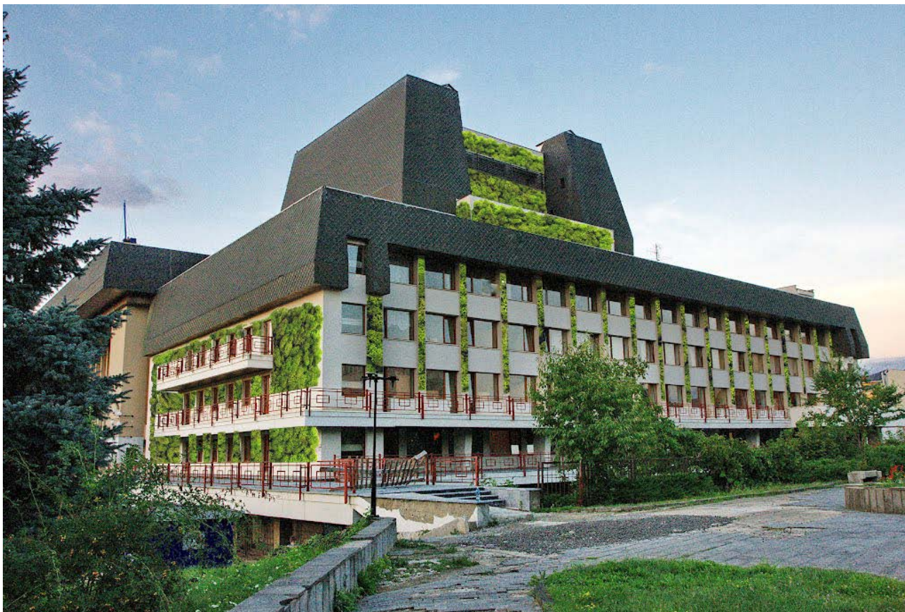
Рис.66. Музично-драматичний театр м. Ужгорода