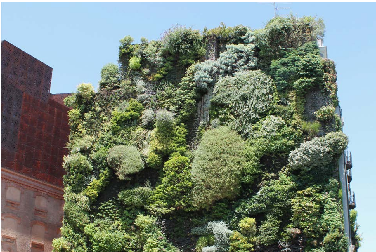
Рис. 3. Суцільна система живих стін, Caixa Forum, Мадрид.

На думку авторів [12] вертикальне озеленення в містах за рахунок своїх первинних властивостей виконує наступні функції: конструкції виглядають естетично і позитивно впливають на психічний стан людини (зелений колір рослин); рослини спричиняють тонізуючу та заспокійливу дію (запахи), знезаражують і очищають навколишнє середовище (фітонциди), стабілізують температуру в будинку, рослини є природними біоіндикаторами, також підкреслюють архітектуру будівель, надають йому оригінального вигляду і при цьому ховають деякі дефекти (нерівності, тріщини).