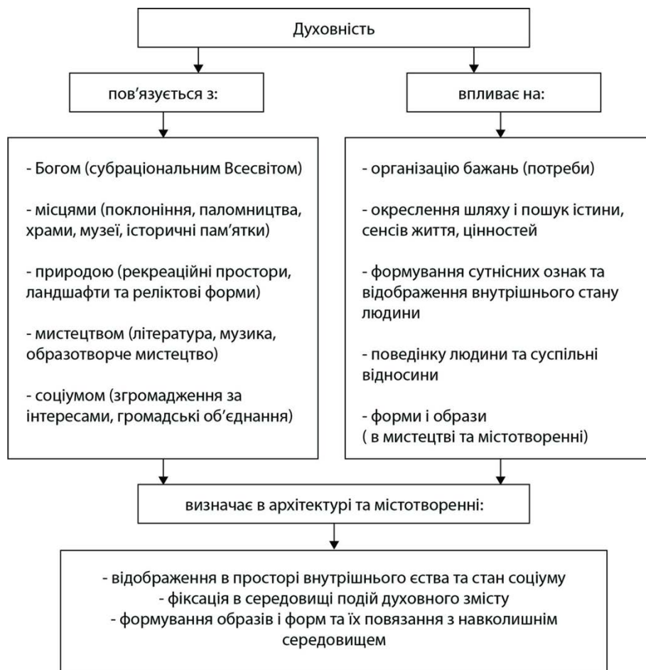
Рис. 1. Духовність як архітектурно-урбаністичний феномен

Духовність як субраціональний і архітектурно-урбаністичний феномен зображено спрощено на рис. 1.