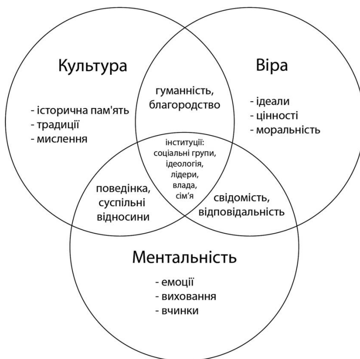
Рис. 2. Модель духовності міста

Дух міста слід розглядати як невід'ємну складову міського способу життя, адже він визначає форми спілкування людей та впливає на потреби. Матеріальні аспекти теж не можна недооцінювати для досягнення стійкості міст і гармонізації міського життя. Нами введені три фундаментальні категорії духовності міста: віра, культура, ментальність, які, відповідно, включають взаємопов'язані й взаємодоповнюючі характеристики (рис. 2).